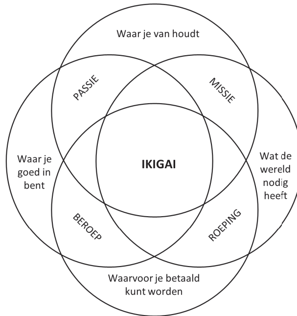
Figuur 1: Ikigai

als: hoe kan ik onze Product Backlog refinement verbeteren? En: hoe kom ik tot goede testscenario's? Het kan ook zijn dat je je als (project)manager meer wilt verdiepen in het vakgebied, omdat je veel te maken hebt met analisten en/of Product Owners en ze beter wilt begrijpen en hun toegevoegde waarde beter wilt benutten. En last but not least kun je het boek als studiemateriaal of als naslagwerk gebruiken tijdens je hbo- of wo-studie. Ik ben er van overtuigd dat business analyse nog maar in de kinderschoenen staat en de komende jaren sterk zal groeien (zie eerder: 'Dat wat de wereld nodig heeft'). Ik hoop dat dit boek daar een belangrijke bijdrage aan zal leveren.